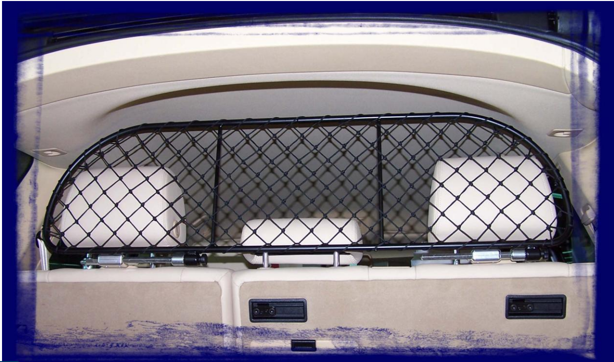
Hundegüter und Hundennetz für Hunde Transport, Kofferraumnetz und Hunde Zubehör

Auch von der ITALIENISCHEN POLIZEI gewählt